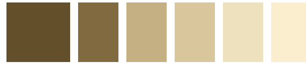
Umbra, grünlich 508